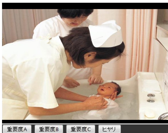
図1 動画視聴の画面

図1は、システムの動画視聴の画面である。学生は、パソコン、または、ケータイのブラウザを利用し、動画教材を視聴して学習する。