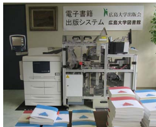
図1 POD システム Espresso Book Machine®(EBM)