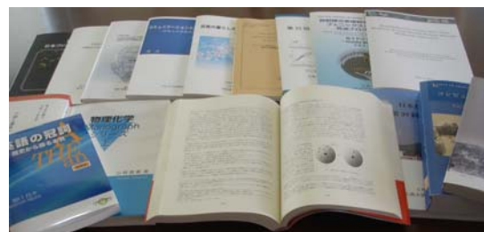
図2 EBM で作成した教科書・教材・学術書・報告書等