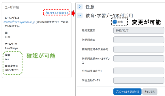
図 4 同意の確認と変更方法

学生からは、自身の Moodle ユーザプロフィールを確認すると、図 4(左) に示すように、自身の同意状況や関連情報が追加表示され、いつでも確認できる。また、「プロフィールを編集する」を選択することで、図 4(右) のチェックボックス「同意」をいつでも変更できるようになる。