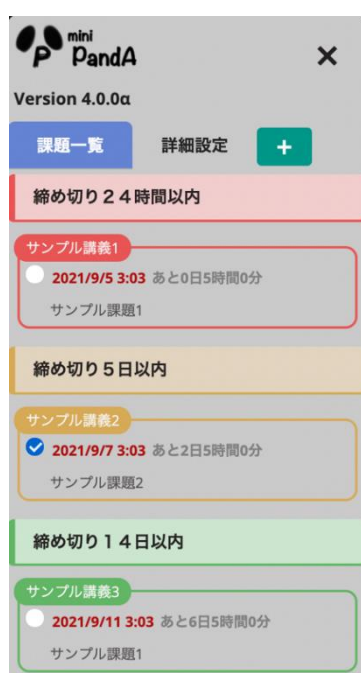
図 2.1 課題一覧の表示

本ソフトウェアは、京都大学の LMS を改善することを目的に作成したブラウザ拡張機能である。拡張機能を導入することで公開されている課題の一覧が確認できる機能や、課題の締切日に応じて LMS の授業ページのタブが色分けされる機能など、学生の利便性を向上させる様々な機能を利用することができるようになる[1]。