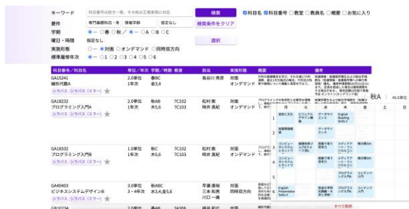
図 5.1 システムのスクリーンショット

「筑波大学 KdB っぽいなにか」は、筑波大学が提供する開講科目データベースである教育課程編成支援システム (KdB) の代替として公開中のシステムである (図 5.1) [7]。