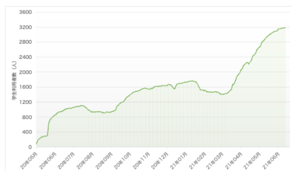
図 2.2 利用者数の推移

本拡張機能を 2020 年 5 月に公開したところ、徐々に評判が広まり 2021 年 9 月現在では 3200 人を越える学生に利用されている。「Comfortable PandA に救われた」「課題一覧機能が本当に使いやすい！」など好意的な評価をもらっている。