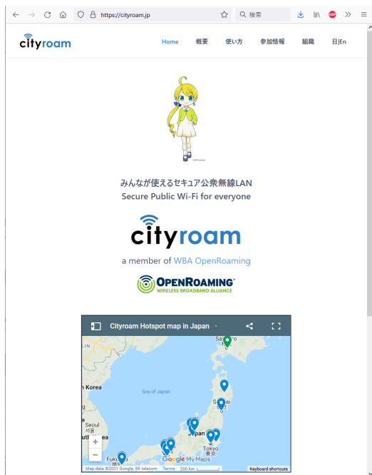
図1 Cityroam ウェブサイト (2021年9月).