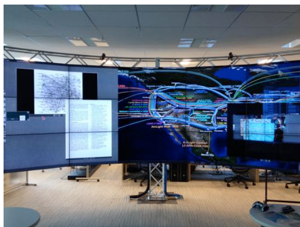
図2. うめきた産学連携拠点の大型可視化装置