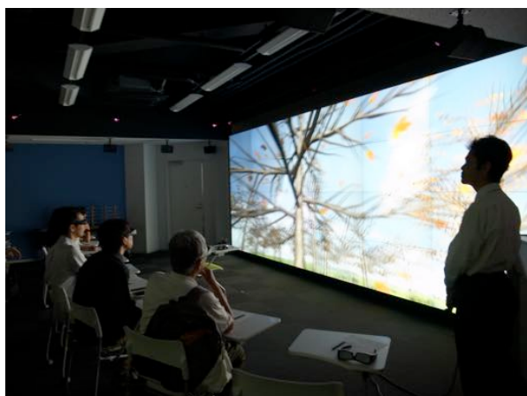
図1. サイバーメディアcommonsの大型可視化装置

本年、本センター吹田本館は耐震補強による改修工事が終了し、吹田本館1階を新たにサイバーメディアcommonsとして運用している。サイバーメディアcommonsは、学生のためのアクティブラーニングスペースであり、情報技術を活かす学生の自主的な活動を支援するものである。先に述べた大型可視化装置は、サイバーメディアcommonsのスペースの一部に設置され、運用している(図1)。